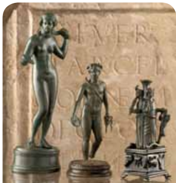
Drei Bronzestaturen der Gottheiten Venus, Apoll und Hekate

2009 wurde das Museum anlässlich seines dreissigjährigen Bestehens von Grund auf saniert. Dieses Jahr findet vom 29. Mai bis 31. Oktober unter dem Titel «Quoi de neuf, docteur?» eine Ausstellung über die Medizin und Gesundheit zur Zeit der Römer statt.