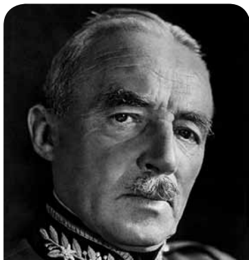
Henri Guisan, Oberbefehlshaber der Schweizer Armee von 1939 bis 1945

Die Historiker haben viel über den Stellenwert seiner Strategien diskutiert, namentlich über die Reduit-Strategie. Allgemein anerkannt sind hingegen sein charismatisches Auftreten, sein Eintreten für den nationalen Zusammenhalt und das Vertrauen, das er in der Armee und in der gesamten Schweizer Bevölkerung zu wecken vermochte.