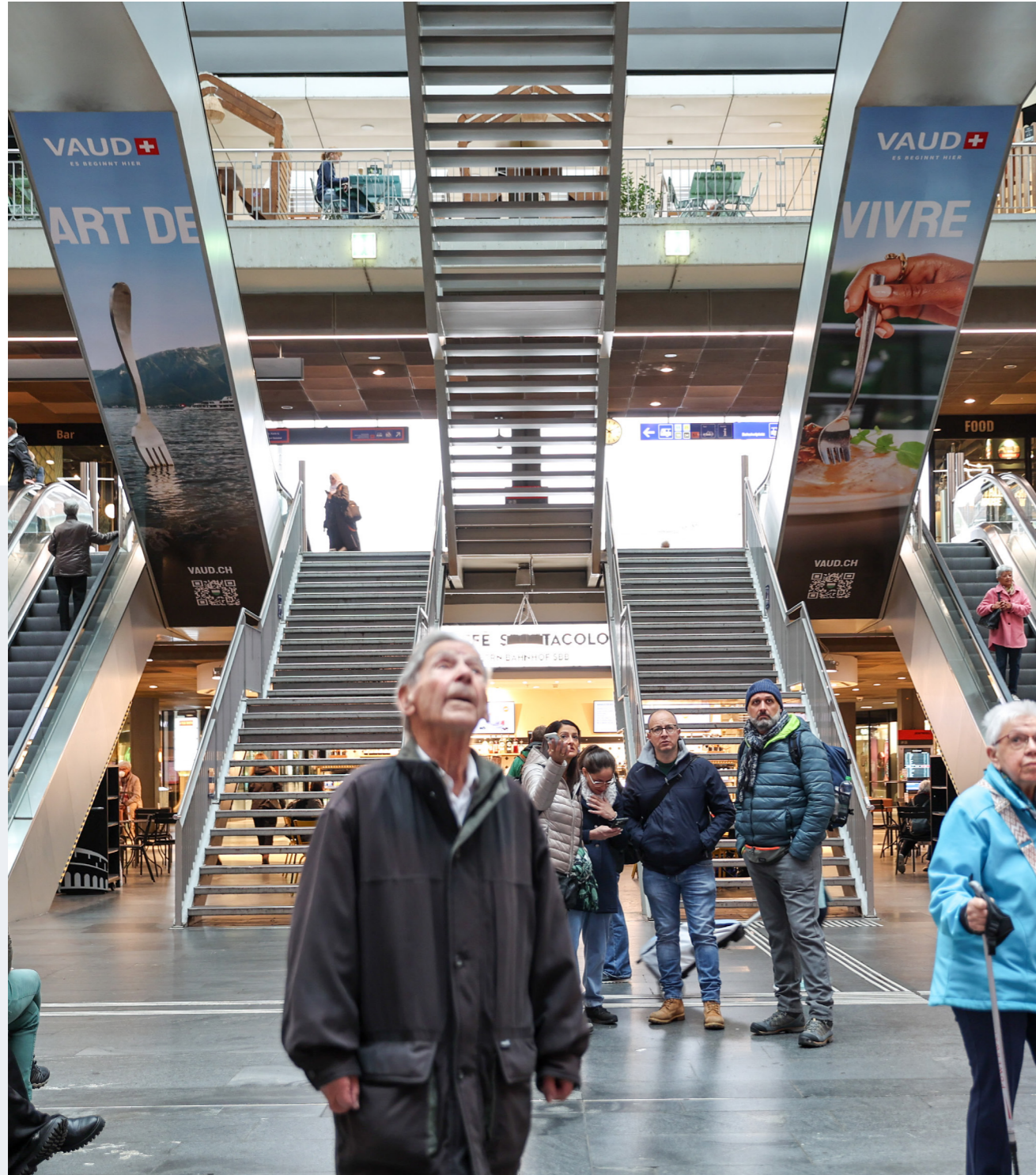
L'art de vivre du Canton de Vaud s'est exposé au centre de la gare de Berne dans un format à la fois original et spectaculaire.