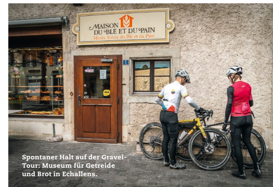
Spontaner Halt auf der Gravel-Tour: Museum für Getreide und Brot in Echallens.

Hier finden Sie alle zertifizierten Waadtländer Produkte: vaud.ch/de/terroir