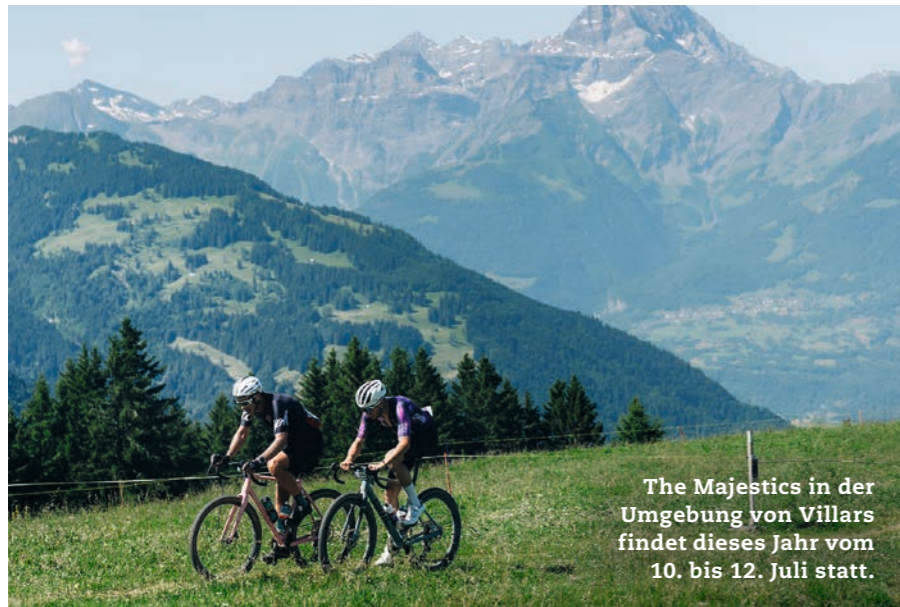
The Majestics in der Umgebung von Villars findet dieses Jahr vom 10. bis 12. Juli statt.

Gravel, MTB, Gran Fondo, Ultrafondo – und dazwischen Weinberge, Alpenpässe und der Genfersee. Die Waadt bietet nicht nur spektakuläre Kulissen, sondern auch einen Eventkalender, der Veloherzen höherschlagen lässt.